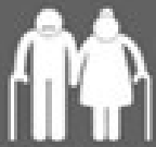
Eres mayor de 65 años

- Sí, si cumples una o varias de estas condiciones -