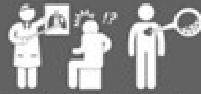
Tienes una enfermedad crónica cardiovascular y/o pulmonar